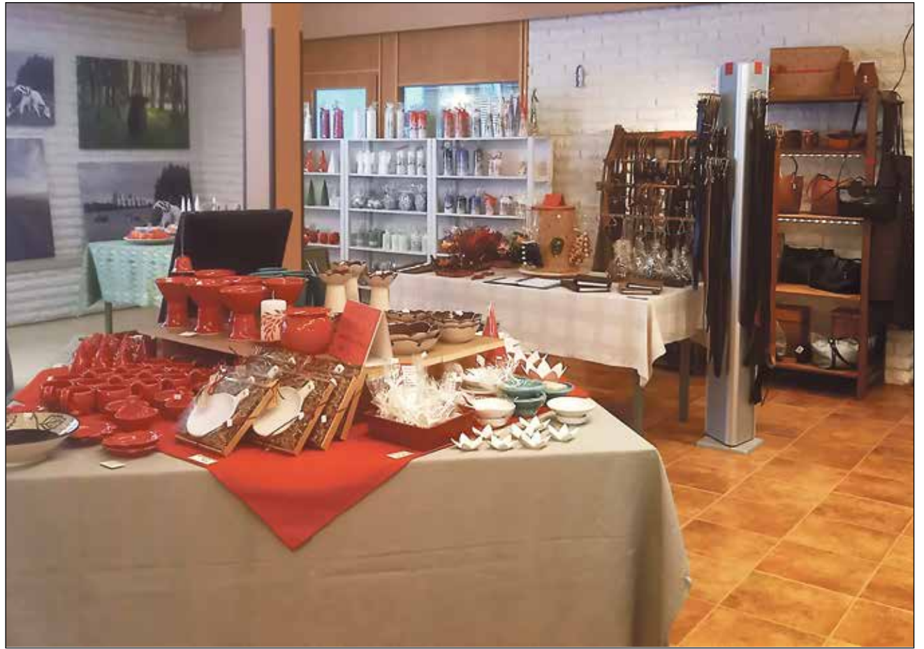
Joulupuodissa on taas tarjolla muun muassa lahjaideoita laidasta laitaan.