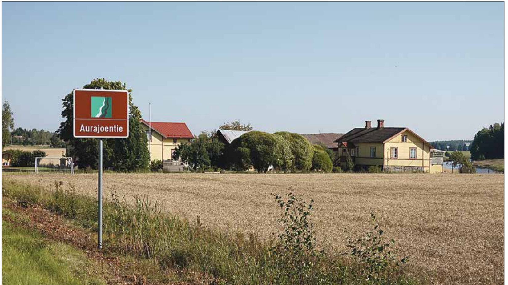
Aurajoen matkailutie kulkee kansallismaiseman lävitse.

Oripäässä joki kiemurtelee vaatimattomana, tuskin havaittavana norona metsäiseltä Tuomistonsuolta merta kohden. Hiljalleen se saa lisää