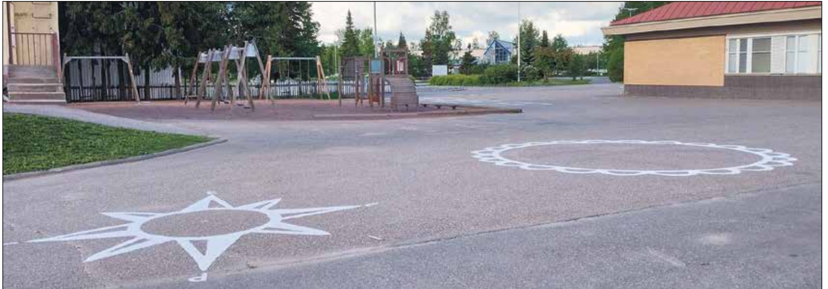
Auran Yhtenäiskoulun asfalttimaalaus.

Auran kunnan ja yhdistysten kanssa toteutettava yhteistyö on alusta asti ollut mukana vanhempainyhdistyksen toimintasuunnitelmassa.