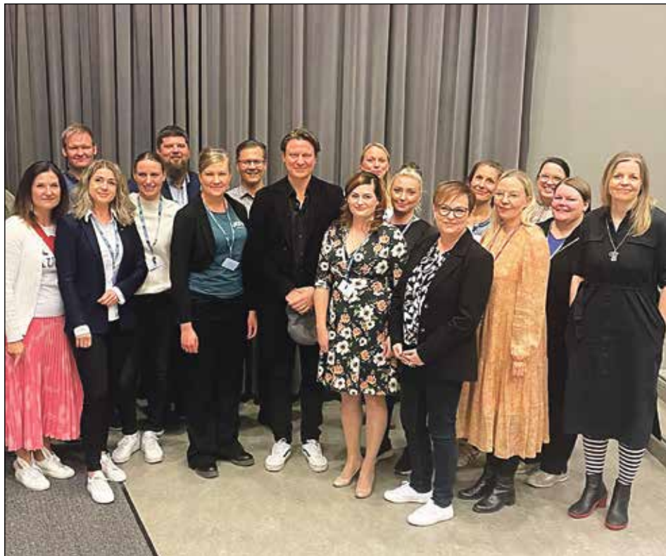
Johtajuuspäivä 8.5.2024 Kyrön Kurkikalissa, järjestäjänä Auranmaan Nuorkauppakamari yhteistyössä Auranmaan kuntien sekä muiden yhteistyökumppanien kanssa.

Toimintamme kulmakiviä ovat koulutukset, projektit ja erilaisten vastuutehtävien kautta oppiminen. Järjestämme myös yritysvierailuja ja vapaa-muotoisia tapahtumia.