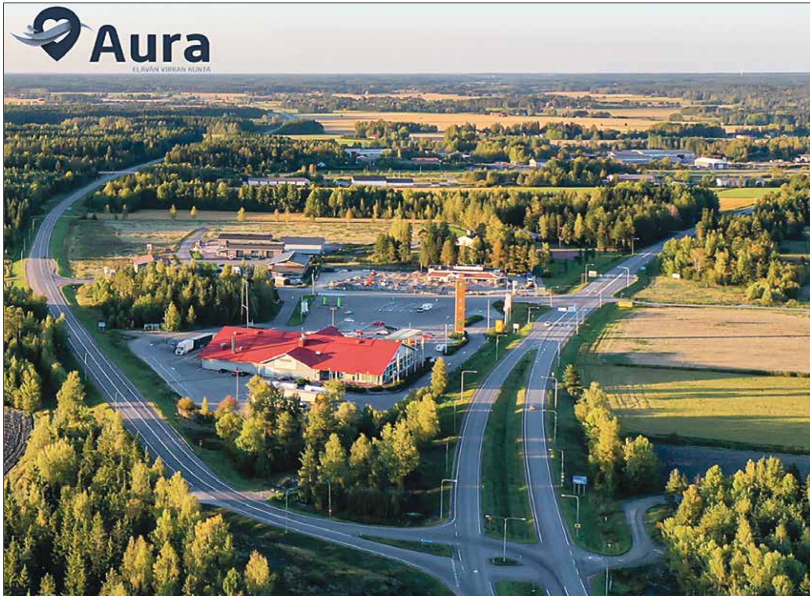
Auranportin sijainti on keskeinen valtateiden varrella.