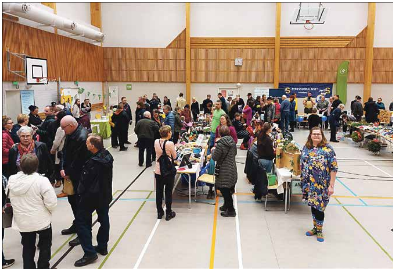
Marttilamessut keräsi taas väen Marttilalle.