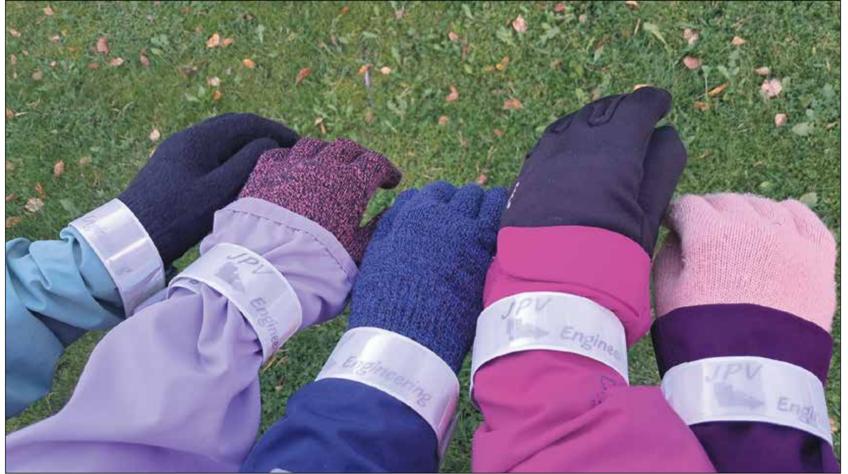
Auran vanhempainyhdistyksen Heijastimet heilumaan! -tempaus.

– Ensimmäinen toimintakausi meni aikalailla tunnustellessa, miten vanhempainyhdistystä pyöritetään ja millaisia toimintamahdollisuuksia ja -ideoita osallisista ja ympäristöstä kumpuaa. Monelle tuossa kohtaa yhdistystoiminta itsessään oli täysin vierasta toimintaa, joten senkin puitteissa lähdettiin pitkälti ”lapsenkengissä” toimimaan. Tästä huolimatta ensimmäisen toimintakauden aikana saimme hurjan paljon aikaa! jatkaa Hörkkö.